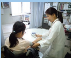
常勤の看護師さんが利用者の方の健康をサポートします。

あいさつやお辞儀、報告の仕方などを練習し、仕事に役立つビジネスマナーを身につけます。