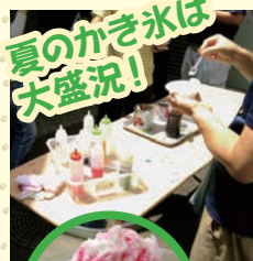
夏のかき氷は大盛況!