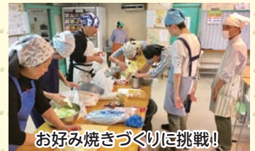
お好み焼きづくりに挑戦!

参加者を募り、映画やアート、カラオケ、クッキングなど休日のイベントを楽しんでいます。